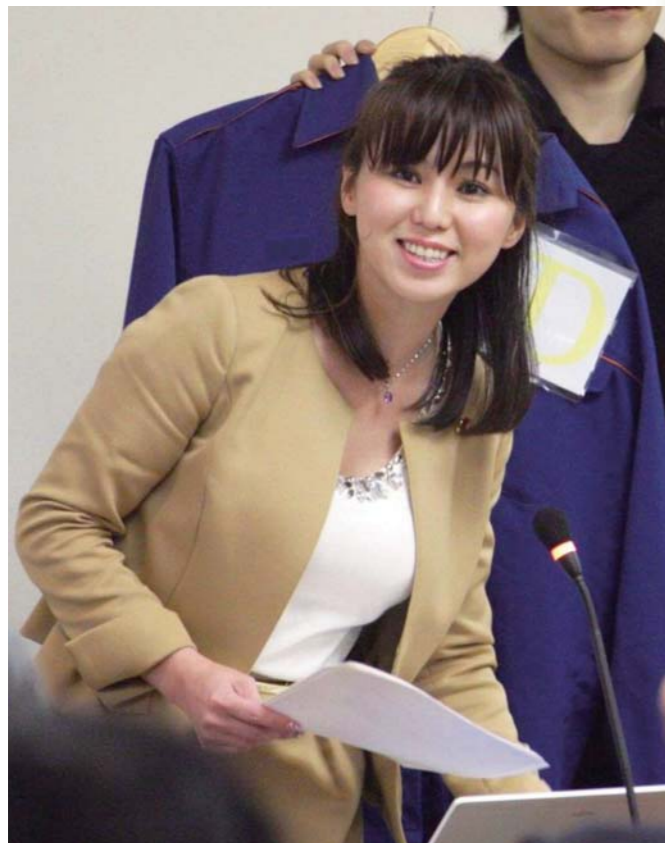
平成25年度予算特別委員会(行財政局) / 2月27日

みんなの党神戸市議員団 2013年4月21日発行 〒650-8570 神戸市中央区加納町6-5-1 市役所1号館26F ●TEL 078-322-6361 ●FAX 078-322-6128 ●携帯 080-6150-0373